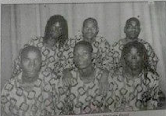
Parte dos membros da banda Dhakala Band.

Para além da produção musical, a banda Dhakala Band, fundada em 1983, tem produzido e lançado vários discos em formato de CD e LP. O grupo também tem realizado concertos em várias cidades do país.